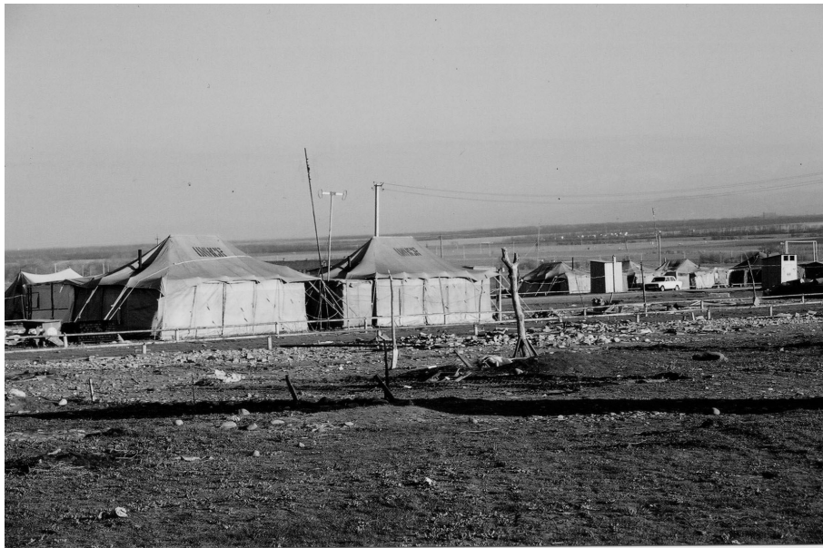
IDP-Lager Satsita