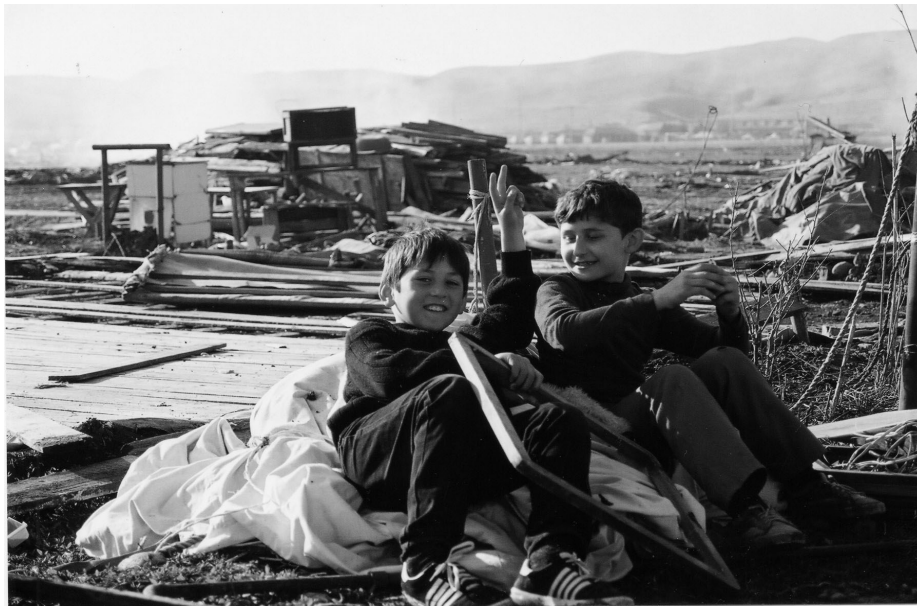
Zwei Jungen spielen in den Ruinen eines ehemaligen Zeltlagers für Binnenflüchtlinge, Sputnik. © ai

en leben, den Druck weiterhin erhöhen werden, um sie zu einer Rückkehr nach Tschetschenien zu veranlassen.