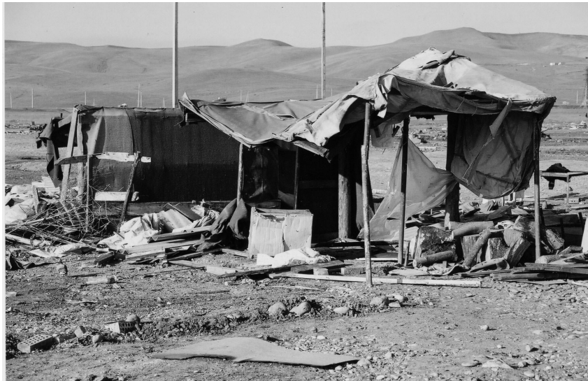
Zelt im IDP-Lager Sputnik am Tag, als es geschlossen wurde (1. April 2004)

Lorchen Gunter, die russland-deutscher Herkunft ist, mit einem Tschetschenen verheiratet war und viele Jahre in Grosny gelebt hat, hat mehr als viereinhalb Jahre in Inguschetien als Flüchtling verbracht. Sie kam in das Zeltlager in Satsita im September 2003 aus dem Lager Bella, das am 1. Oktober 2003 geschlossen worden war. Sie gehört zu den tausenden Binnenflüchtlings, die nicht nach Tschetschenien zurückgehen möchten. Lorchen Gunter erklärte Mitarbeitern von amnesty international, dass die IDPs in Satsita und vorher in Bella starkem Druck von den verschiedenen Behörden ausgesetzt waren, Inguschetien zu verlassen. Sie glaubte, dass ihr Zelt und sie selbst von den Behörden beobachtet würden, da sie als eine Sprecherin für die im Lager angesehen werde, die nicht nach Tschetschenien zurückkehren wollten.